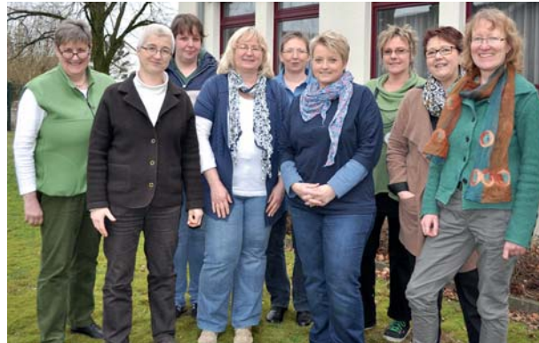
Wir sind gerne für Sie da!

Wir bieten Menschen, die auf Palliativpflege angewiesen sind, eine 24-stündige Rufbereitschaft an.